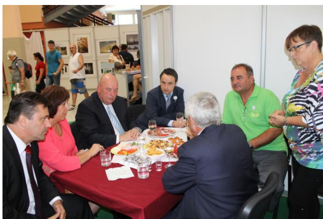
Země živitelka 2013 – návštěva ministra zemědělství v našem stánku