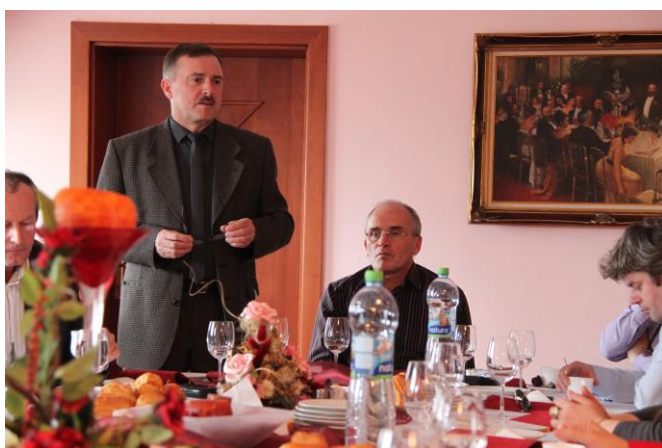
Setkání se zástupci MAS Termál (Slovensko)