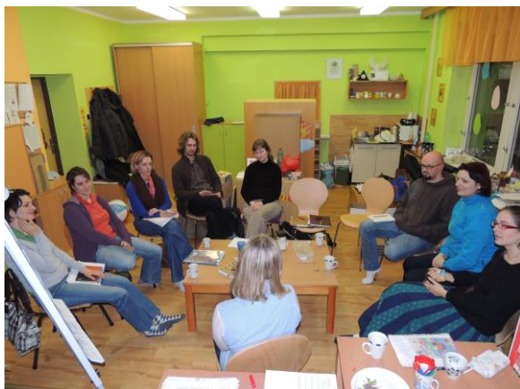
Rodinná centra – projekt spolupráce