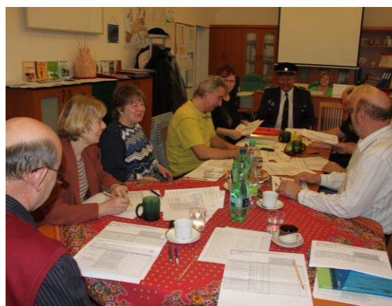
Prezentace projektů výzvy LEADER – veřejné obhajoby