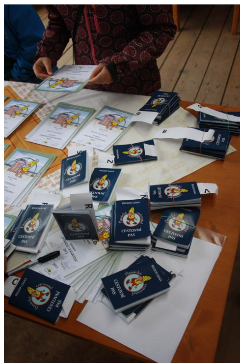
Hanácké cestovatel 2013